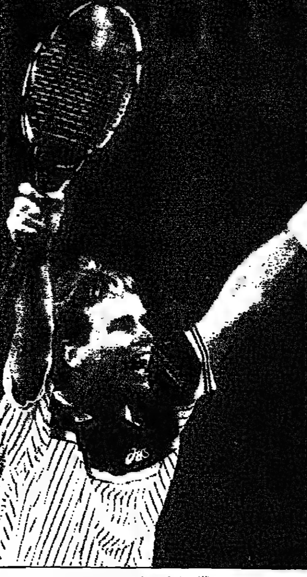
اللاعب الهولندي جان سياميرت

باريس - ا ب في: تسمى السويسرية ماريتشا فينغيس (16 عاماً) للعبة اولي الى احراز لقبها الرابع على التوالي منذ مطلع السنة الحالية عندما تخطت ماز دور باريس لكرة المضرب التي تتخلل اليوم الاحد والثلاثاء فيفد جوائزها 480 الف دولار، وكانت فينغيس للسنة الثانية في العالم احراز دورة مضرب وبطولة استراليا للفترة ودورة طوكيو من دون ان تخسر في من مبارياتها الستة. وتصل فينغيس على الذي لعبه ان تصبح اصغر لاعبة تحت الركن الاول في تصنيف اللاعبات المحترفات، علماً بان اليوغسلافية الاصل الامريكية الجنسية